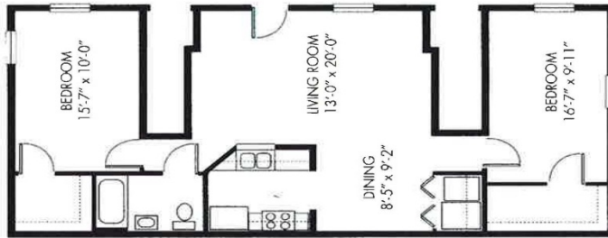
TWO BEDROOM FLAT FIRST FLOOR ONLY