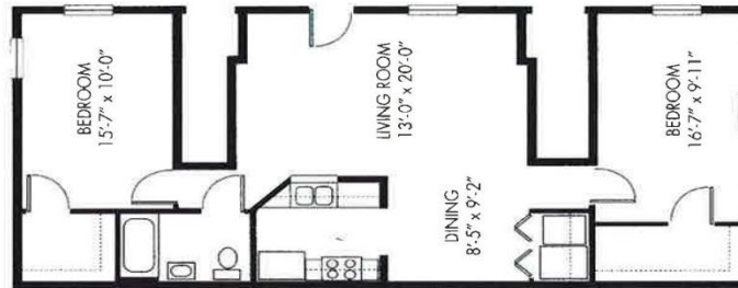
TWO BEDROOM FLAT FIRST FLOOR ONLY