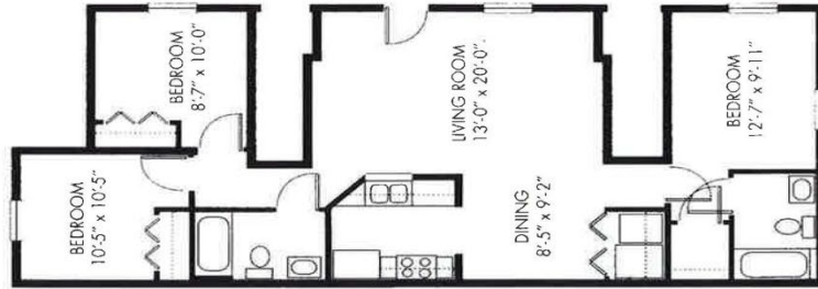
THREE BEDROOM FLAT FIRST FLOOR ONLY